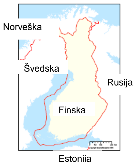
Karta: © Geodetski zavod

Finska je postala nezavisna država 1917 godine. Prije toga Finska je otprilike bila 600 godina dio Švedske i od godine 1809 dio Rusije. Za vrijeme Ruske vladavine Finska je bila autonomija i vlastita uprava počela je funkcionisati. Nakon nezavisnosti Finska postala je republika. Finska je evropska pravna država, čiji službeni rad zasniva se po zakonu. Takođe, Finska je demokratska država: narod bira predsjednika, nacionalnog parlamenta i opštinske (= mjesne, područja) donosioce odluka.