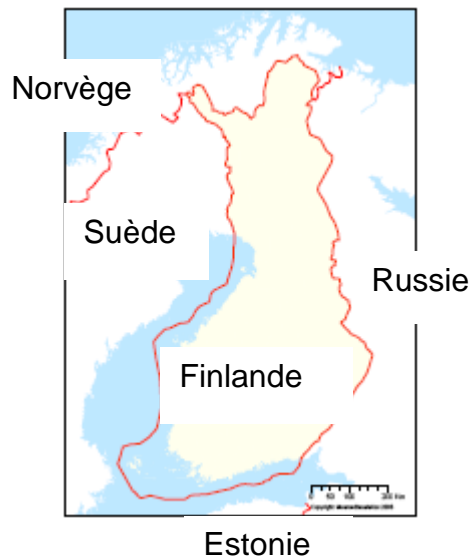
Carte : © Maanmittauslaitos

La Finlande accéda à l'indépendance en 1917. Auparavant la Finlande avait d'abord appartenu pendant environ 600 ans à la Suède, puis à partir de 1809, elle avait fait partie de la Russie. Durant la période russe, la Finlande était un Etat autonome avec sa propre administration. Après l'accession à l'indépendance, la Finlande devint une république. La Finlande est un Etat de droit européen où toutes les actions des pouvoirs publics sont basées sur la loi. La Finlande est aussi une démocratie : le Président, le Parlement et les dirigeants municipaux (= locaux, régionaux) sont élus par le peuple.